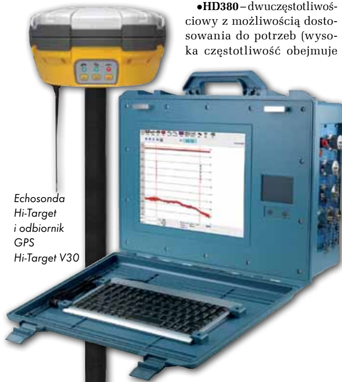
Echosonda Hi-Target i odbiornik GPS Hi-Target V30